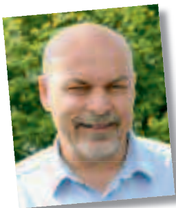
Frank Böhm Anschlusswesen Strom